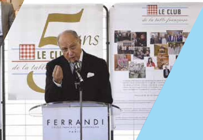
Laurent Fabius promeut la diplomatie gastronomique - 2015