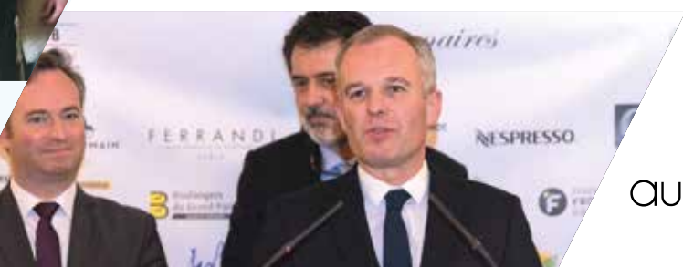
François de Rugy au Grand Dîner du Club - 2018