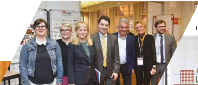
Conférence de lancement du livre Français Langue Étrangère « A Table ! » - 2017

Promouvoir l'art de vivre à la française caractérisé par la convivialité et le plaisir dans l'alimentation. Utiliser la gastronomie comme vecteur de la francophonie. Mettre en place les mesures de sauvegarde proposées lors de l'inscription du repas gastronomique des Français au patrimoine culturel immatériel de l'UNESCO.