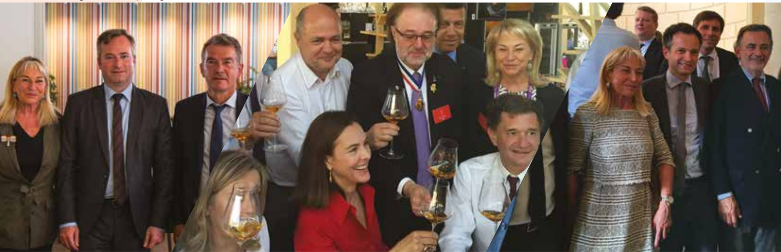
Déjeuner-débat autour de Jean-Baptiste Lemoyne - 2018