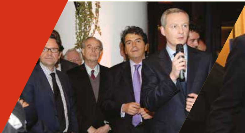
4 Ministres au dîner célébrant l'inscription du «Repas Gastronomique des Français» par l'UNESCO - 2011

Développer le potentiel de production et soutenir les acteurs des secteurs de la Table. Valoriser les filières qui participent au succès de notre gastronomie.