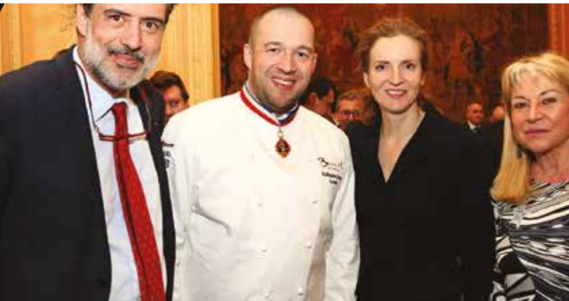
Le Grand Dîner - 2017